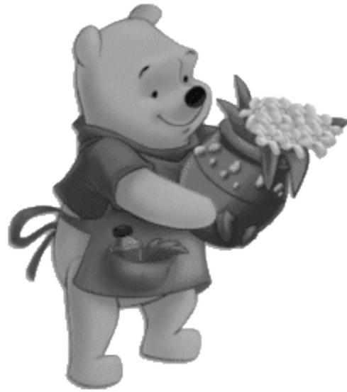
RAJAH 2. Target fiksasi gambar kartun yang dikaji

Semua data amplitud dan tempoh pendam pERG direkodkan dan dianalisa menggunakan perisian Statistical Packages for Social Sciences (SPSS) versi 16.0. Kenormalan data diuji terlebih dahulu dengan memerhatikan nilai statistik Shapiro-Wilk kerana sampel kajian adalah kurang daripada 100. Hasil ujian Shapiro-Wilks menentukan